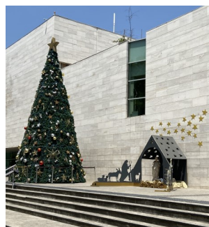
Weihnachten Down-Under Bilder von Christel Jensen, aufgenommen während ihrer Weltreise 2022/23.