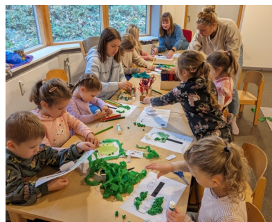
Kinderkirche zum Thema Zachäus