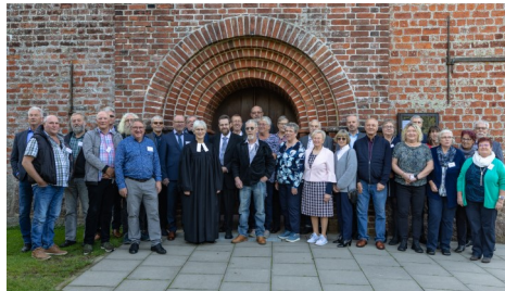
Goldene Konfirmation im Oktober