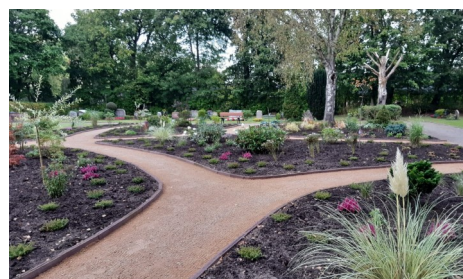
Unser neues Urnenfeld