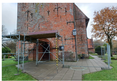
Gerüst vor dem Kircheneingang